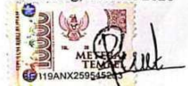
Puput permata sari