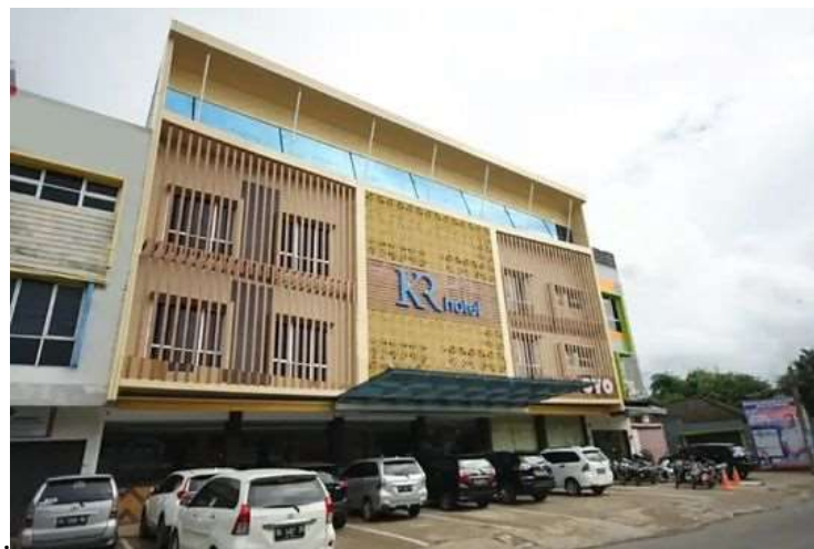
Gambar 1.1 Hotel KR Palembang

layanan ke dalam kategori must-be, one-dimensional, attractive, indifferent, dan reverse, sehingga manajemen dapat memprioritaskan perbaikan layanan secara lebih strategis dan efisien. Penelitian sebelumnya menunjukkan bahwa masih terdapat gap negatif pada dimensi responsiveness dan reliability, serta adanya atribut attractive yang berpotensi meningkatkan kepuasan secara signifikan meskipun bukan ekspektasi dasar pelanggan.