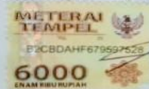
Noel Yobel Situmeang