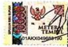
Fujiati Wulandari Pratiwi